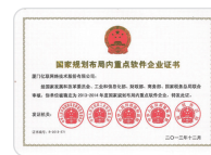
国家规划布局内 重点软件企业