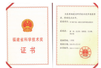
福建省 科学技术奖