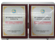
一站式视频会议解决方案 & 年度产品奖