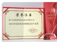
年度最佳 企业视频会议产品奖