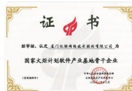
国家火炬计划 软件产业基地骨干企业