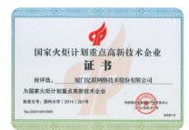
国家火炬计划 重点高新技术企业证书