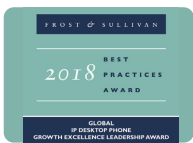
2018 Frost&Sullivan 卓越增长力领导奖