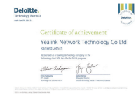
德勤亚太 高科技成长500强