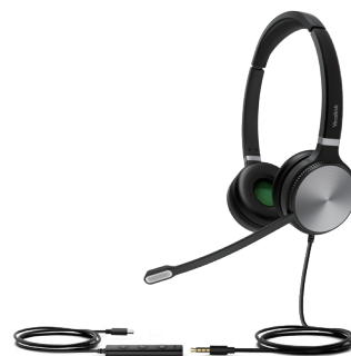
UH36 Dual Teams UH36 Dual UC