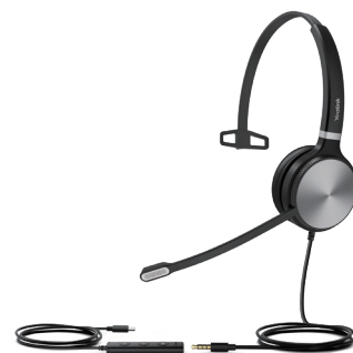
UH36 Mono Teams UH36 Mono UC

UH36 与亿联 IP 话机深度集成，一些高级功能可通过 USB 控制器轻松实现，例如，多路通话控制，音量同步等。