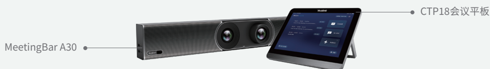
MeetingBar A30 中型会议室 一体机方案