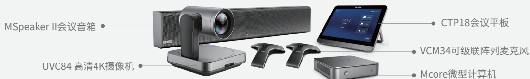
TVC 840 大型会议室 高端分体机方案