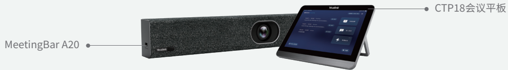
MeetingBar A20 小型会议室 一体机方案