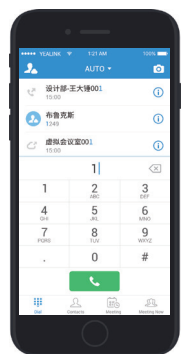
Yealink VC Mobile

支持H.323及SIP双协议，与业界主流的标准系统和终端具有良好的兼容性及互操作性，可灵活扩展、自由对接多种视频会议终端。