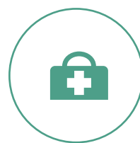
远程终端诊断 降低系统运维成本