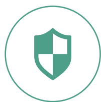
加密技术 保护会议信息安全